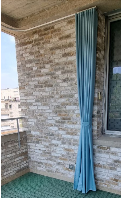
Halteposition bei Abwesenheit (Sicherung in Endstellung)